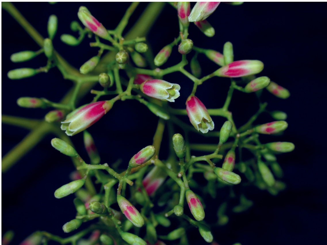
Figura 2. Cedrela domatifolia , flores. Terreros 417 (MOL)