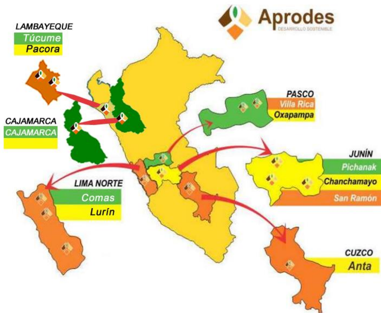
Figura N° 01: Ámbito de Intervención

Las actuaciones de APRODES se orientan a todo el ámbito nacional del país, pero con particular incidencia en los corredores norte, centro y sur del Perú.